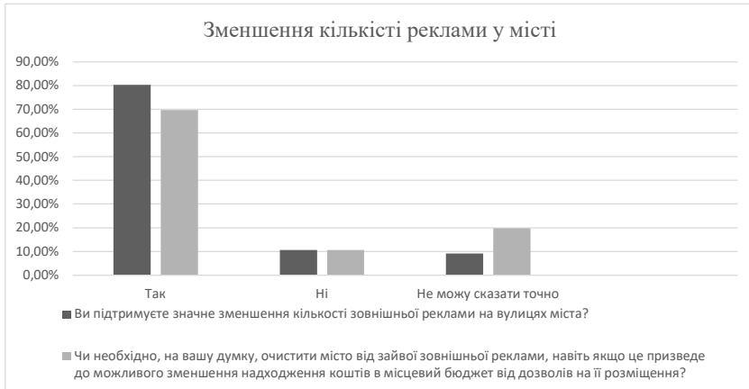
Рис. 1. Думка громадськості щодо зменшення реклами у місті

місцевого бюджету у зв'язку зі зменшенням надання дозволів на встановлення рекламних конструкцій (рисунок 1). (Опитування проводилось студенткою третього курсу спеціальності «Документознавство та інформаційна діяльність» Лесюк Ольгою протягом двох місяців 2020 року засобами соціальної мережі Facebook)